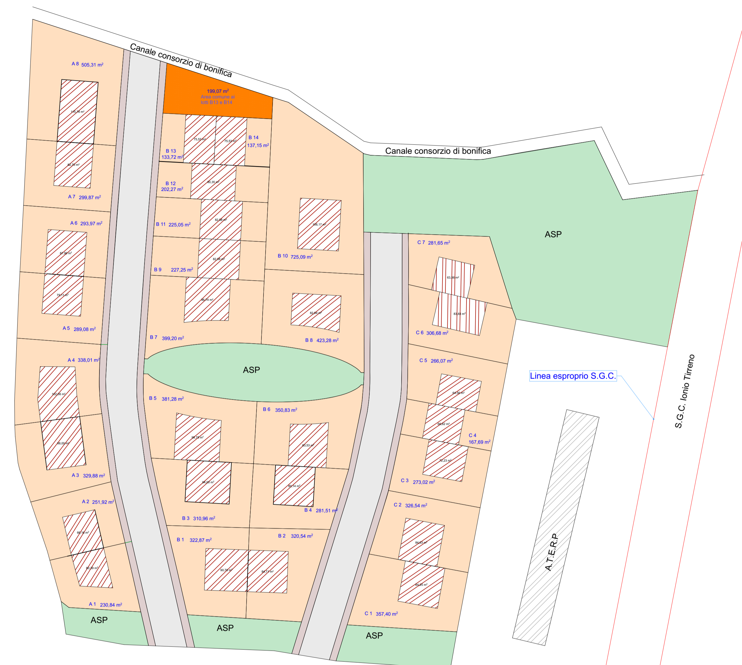
Planimetria di progetto sc 1:500